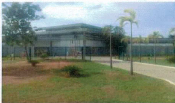
Foto: Resolve Palmas Região Sul - Taquaralto.

A Prefeitura de Palmas possui uma unidade do Resolve Palmas Região Sul, numa área construída de 1.700m 2 , possui 30 guichês, com 225 serviços, para atendimento ao público. Possui ainda sala de atendimento empresarial, sala de reuniões, auditório com capacidade para 60 pessoas e refeitório para colaboradores. Visa descentralizar o atendimento das Pastas da Prefeitura concentrando os serviços num único local. Localiza-se na Quadra 31, Taquaralto, no Antigo Shopping da Cidadania.