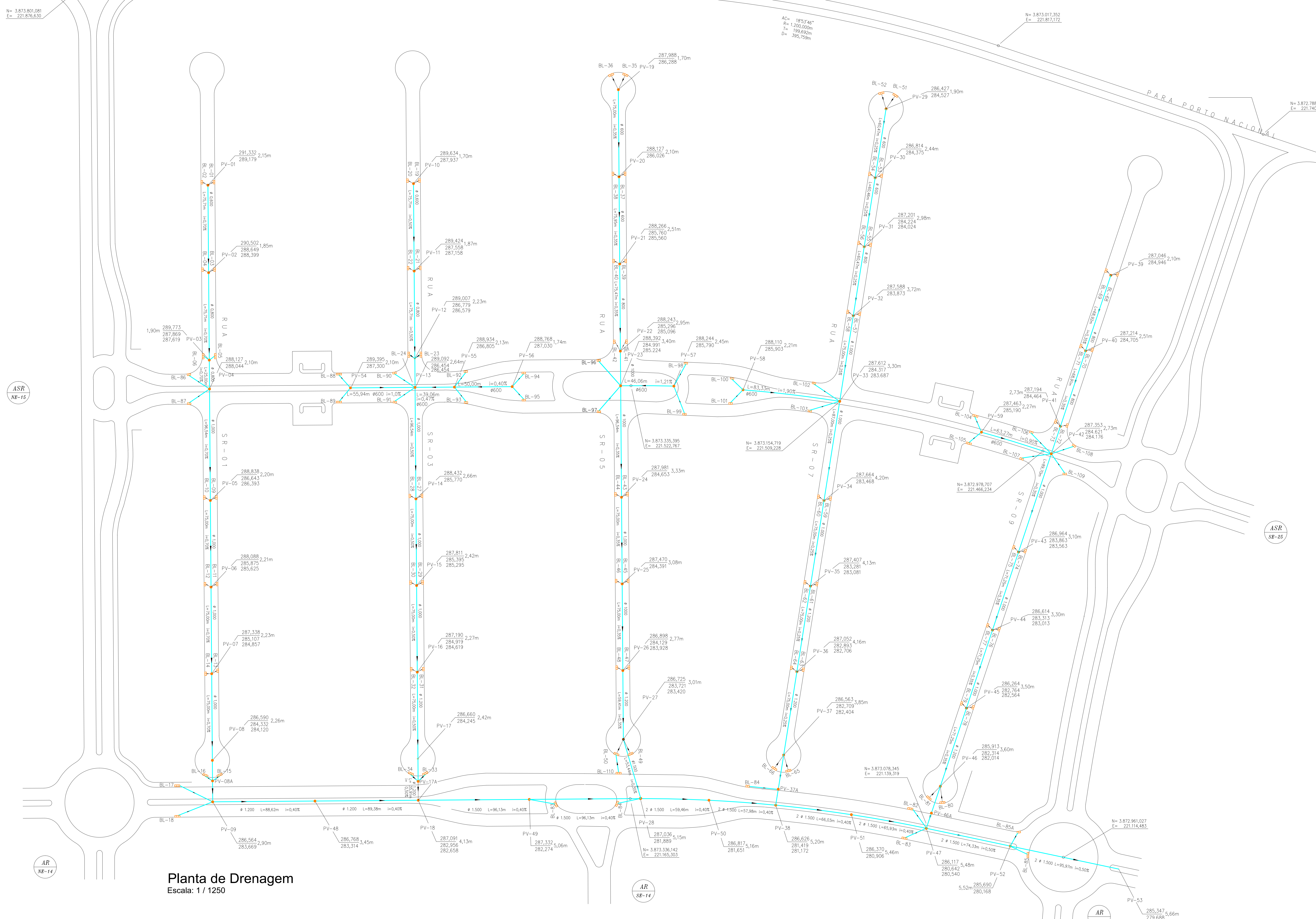
Planta de Drenagem Escala: 1 / 1250