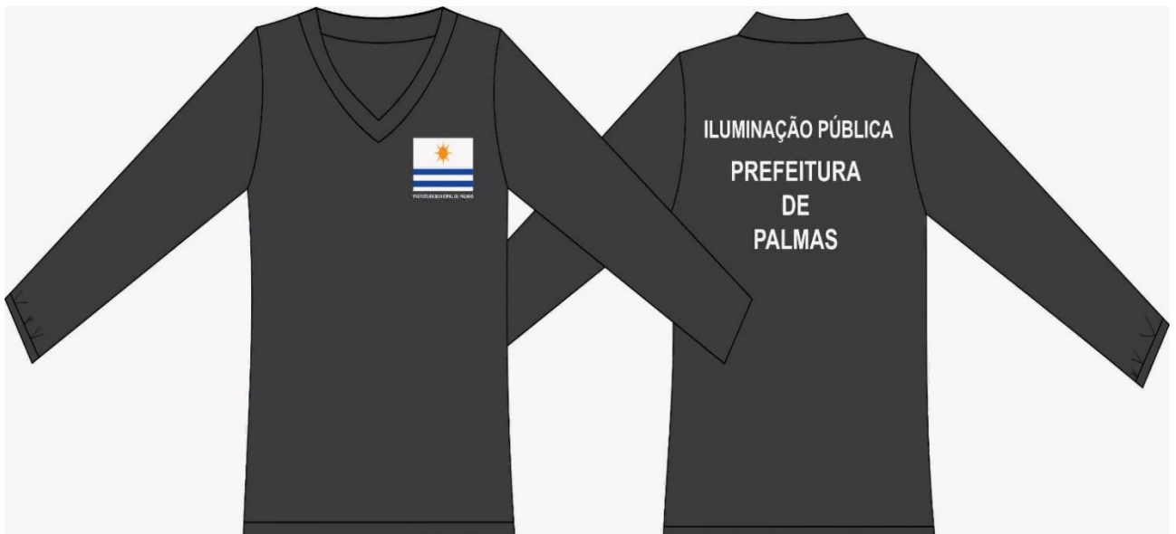
MODELO DO ITEM 04