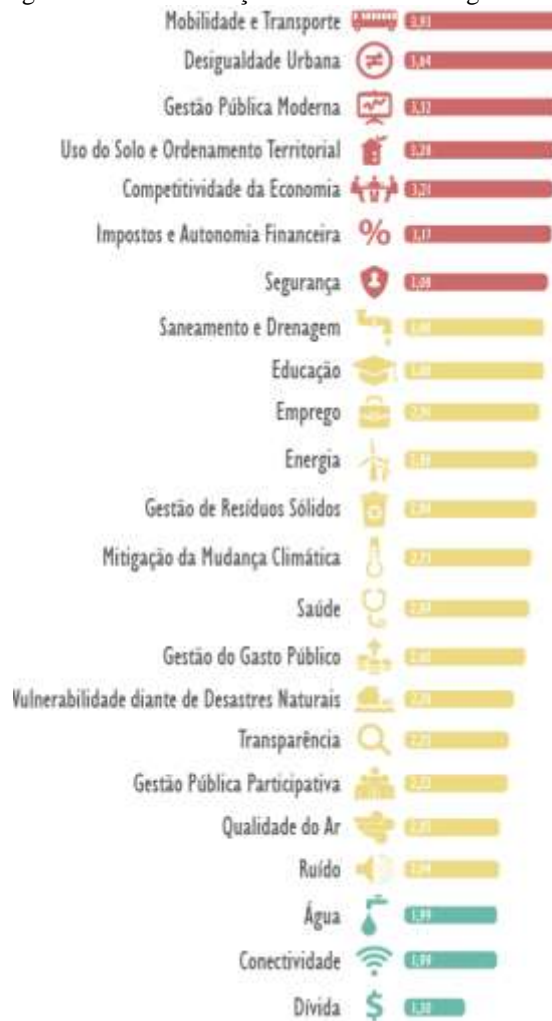
Figura 2 – Ranking de temas da avaliação no âmbito do Programa Palmas Sustentável