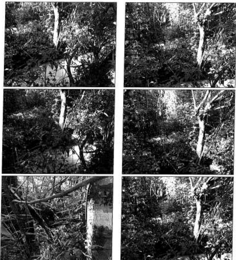
Foto 01 – Local de execução de obra de arte especial sobre o Córrego Santa Bárbara.

PREFEITURA MUNICIPAL DE PALMAS Secretaria Municipal de Infraestrutura e Serviços Públicos Quadra 1.212 Sul, Av. LO-27, esquina com NS-10, CEP: 77.024-540, Palmas-TO Telefone: (063) 2111-0616 - E-mail: gabinete.seisp@gmail.com