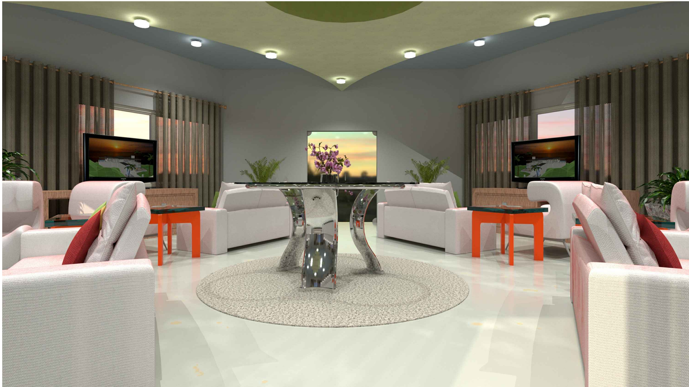
ESPAÇO DE CONVIVÊNCIA - BLOCO 6