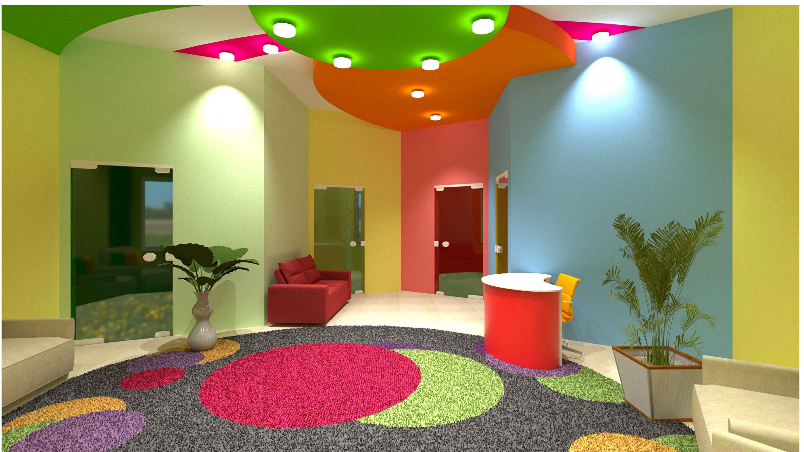
RECEPÇÃO/ACOLHIMENTO - BLOCO 5