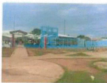
Centro Municipal de Educação Infantil Cantinho da Alegria

Já na Educação Infantil há o Centro Municipal de Educação Infantil Cantinho da Alegria, localizado na Av. Taquari, Esquina com a Rua 07 – Taquaralto, com capacidade de atendimento para 555 crianças, em 2018 foram matriculados 499, tendo disponível 56 vagas para a comunidade no berçário 2 ao Pré-Escolar 02. Conta ainda com uma extensão que oferta apenas o 1º ano do ensino fundamental com capacidade para atender 100 crianças, em 2018 foram feitas 87 matrículas, ainda há 13 vagas disponíveis para as famílias dessa comunidade. Também existe na rede no Bairro de Taquaralto o Centro Municipal de Educação Infantil Miudinhos e o Sonho de Criança.