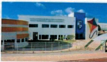
Colégio Esportivo Militar do Corpo de Bombeiros (CEMIL) Profª. Margarida Lemos Gonçalves

Cita-se ainda o Colégio Esportivo Militar do Corpo de Bombeiros (CEMIL) Profª. Margarida Lemos Gonçalves, que fica localizada no Setor Lago Sul, APM 11, Rua João Pires Querido Filho, Palmas-TO, que atende as demandas oriundas do empreendimento habitacional Ipê Amarelo. No CEMIL a estrutura é para tempo integral, com quadra poliesportiva coberta, auditório, teatro, refeitórios, banheiros adaptados, biblioteca, área de lazer, piscina, salas de aulas climatizadas, entre outros. Sua capacidade de atendimento é para 1.034 alunos, em 2018 foram matriculados 1022 alunos, tendo 12 vagas disponíveis à comunidade local. Ensino é distribuído do 2º ao 9º ano do ensino fundamental, os estudantes têm, além das disciplinas tradicionais, treinamentos nas modalidades de xadrez, futsal, handebol, tênis de mesa, atletismo, judô e natação. Além do treinamento desportivo, o sistema educacional da unidade conta também, com disciplinas militares como civismo e primeiros-socorros ministradas pelo Corpo de Bombeiros. Foi inaugurado em fevereiro de 2016.