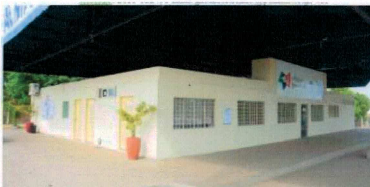
Estação Juventude do Setor Santa Bárbara

A Estação Juventude do Setor Santa Bárbara, fica na Rua 01, Quadra 08, Lote 27, no Setor Santa Bárbara, desenvolve diferentes projetos, o objetivo central é um espaço para o desenvolvimento social dos adolescentes e jovens, da promoção das políticas públicas de Juventude de Palmas. Para isso conta com um quadro de profissionais selecionados com qualificação nas diversas áreas sociais para um perfeito desenvolvimento das atividades que são ofertadas.