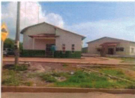
Base Comunitária de Segurança da Polícia Militar- 3ª CIA OPERACIONAL 6º BPM

Como exemplo, cita-se os moradores do empreendimento Ipê Amarelo, que contam ainda com o transporte coletivo público com suas linhas alimentadoras em frente ao próprio empreendimento, na Avenida do Contorno, realizado pela Linha Santa Barbara (46). A comunidade recebeu um novo ponto de ônibus com estrutura metálica autossustentável. O abrigo possui, entre outras novidades, lâmpadas de LED e painel eletrônico com entradas USB, alimentados por energia solar. Outras melhorias, como a conexão de internet Wi-Fi gratuita, calçada nivelada com rampa para cadeirantes e iluminação de LED na faixa de pedestre, que garante melhor visibilidade da travessia por condutores a 800 metros de distância. Além disso, o novo ponto abriga uma câmera de monitoramento interligada a uma central de monitoramento 24 horas por dia.