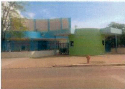
ETI Santa Bárbara

Na área da EDUCAÇÃO , a comunidade é atendida pela Escola de Tempo Integral Santa Bárbara, localizada na Rua 7, APML – 5ª Etapa – Jardim Santa Bárbara – com capacidade de atendimento para 669 crianças e adolescentes com 591 alunos matriculados (1º ao 5º ano), tendo 78 vagas disponíveis à comunidade, além da Escola de Tempo Integral Caroline Campelo Cruz da Silva, ETI Luiz Rodrigues Monteiro, Escola Municipal Maria Rosa Castro Sales, localizadas no Bairro de Taquaralto.